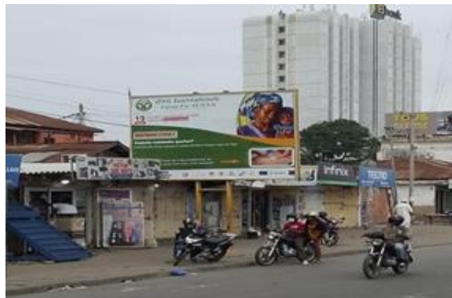
Les affichages effectués sur les grands artères de la ville pour sensibiliser