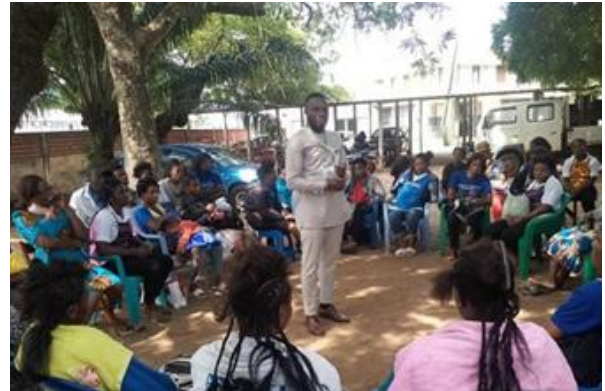
Le chargé de communication de "Caring For all " venant en appui à la séance de sensibilisation conduite par les coiffeuses