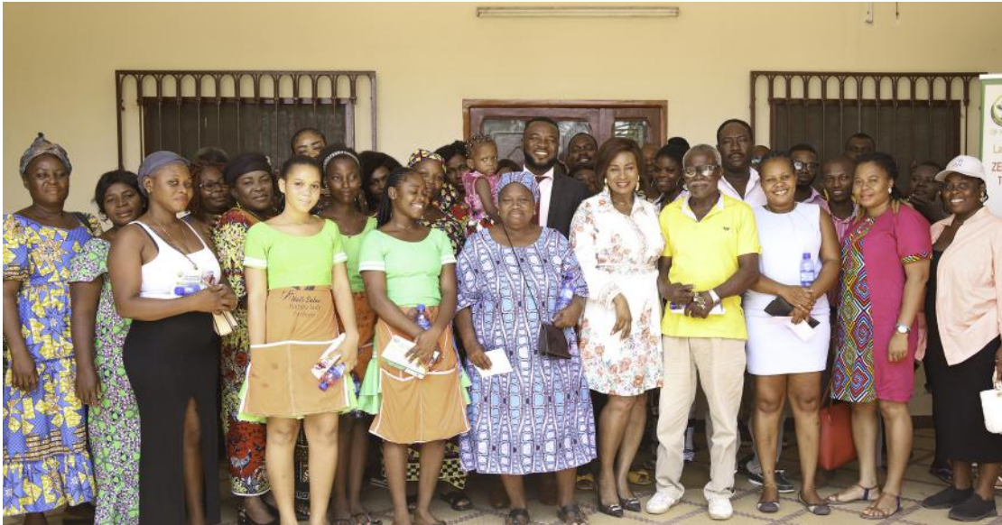
Le public présent à la séance de sensibilisation