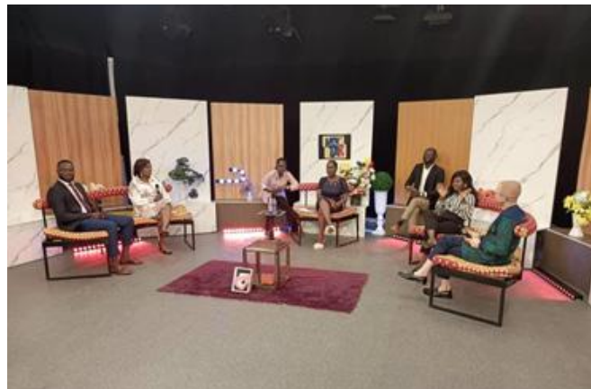
La présidente et le chargé de communication dans l'émission « NEKTAR » sur la TVT