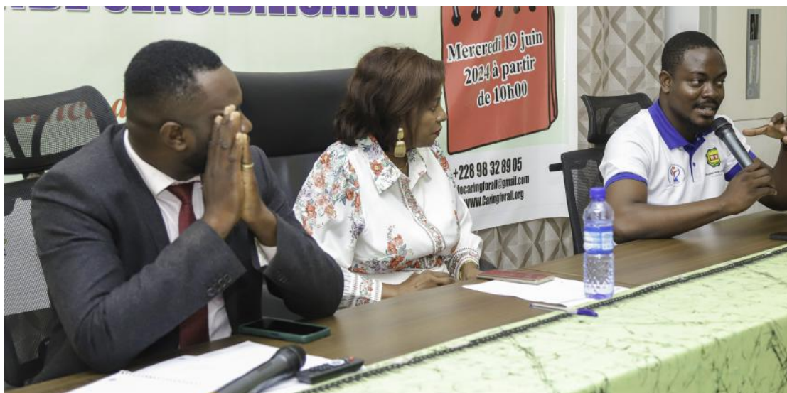
L'intervention du médecin Hématologue