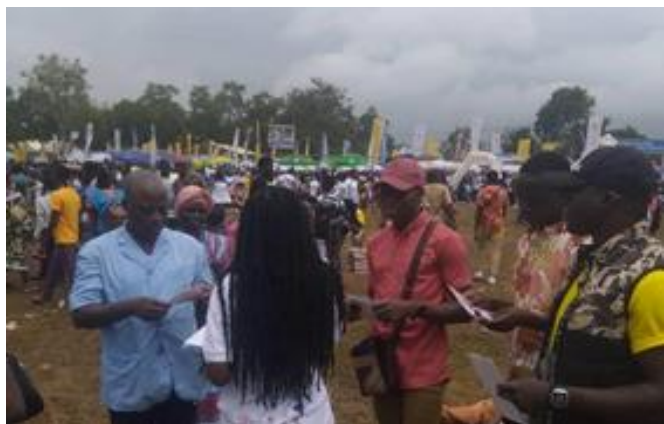
Les Hôtesses sur les différents terrains de lutte