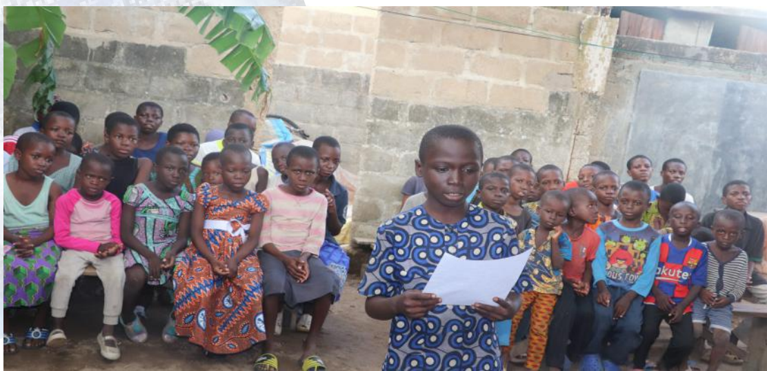
Les mots de remerciement adressés à la présidente par les enfants de l'orphelinat