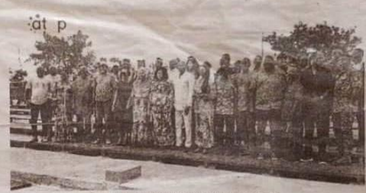
Photo d'ensemble sur l'une des tribunes construites.

Deux tribunes de 400 places dénommées Tribunes de l'Unité ou United Platform en anglais ont été réceptionnées le samedi 13 juillet sur le terrain rouge des Evala à Pya, dans la commune de Kozah 2.