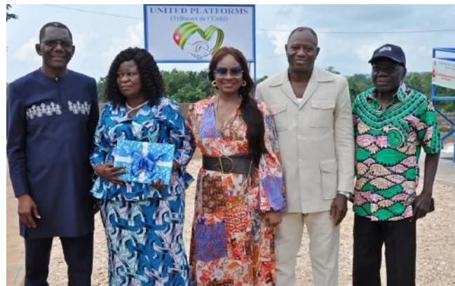
Cérémonie de la remise symbolique de la tribune à madame le maire de la commune kozah 2 en présence du chef canton et du président des ressortissants du canton de Pya