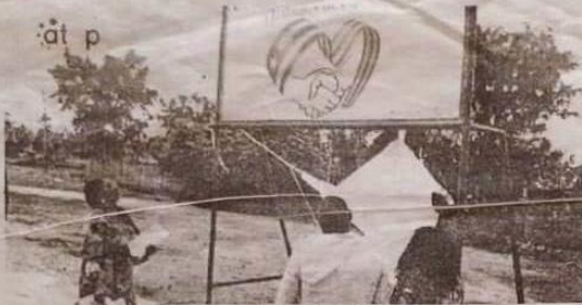
Dévoilement de la plaque des 2 tribunes d'unité.