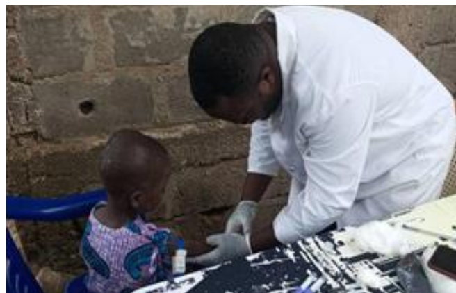
L'équipe de prélèvement au nord et les responsables de l'orphelinat Gloire à Dieu