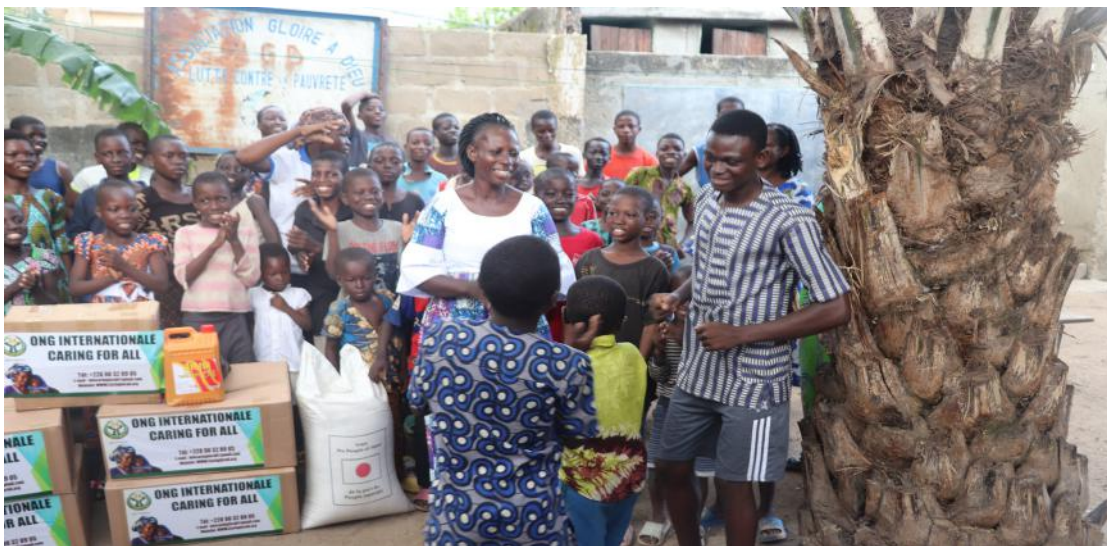
Un moment de joie partagé avec les enfants