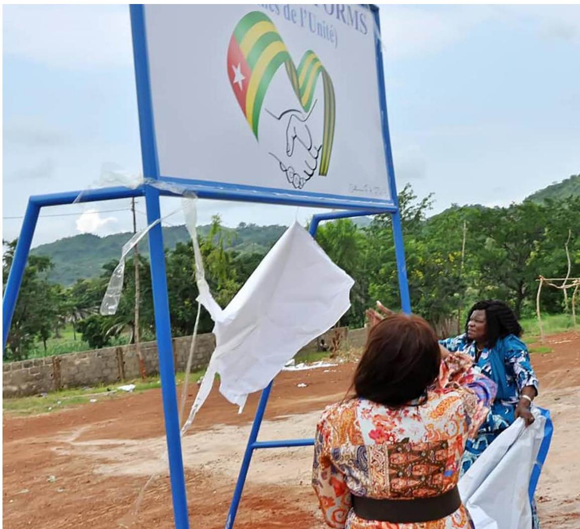
Cérémonie de réception des tribunes