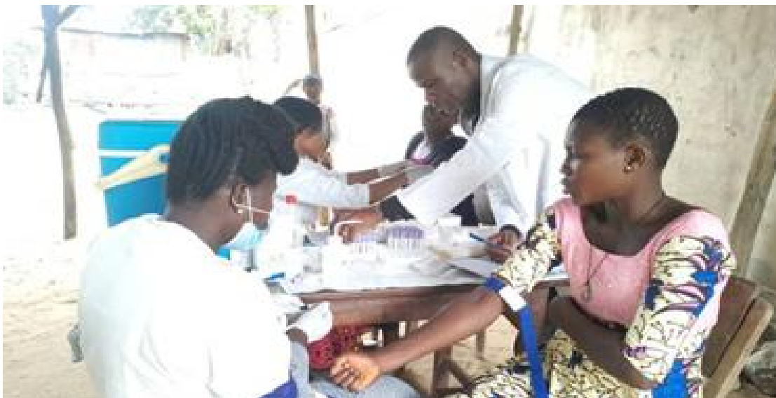
Séance de prélèvement à Iomé